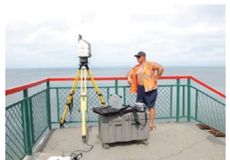
Примеры фиксации прибрежной полосы тихоокеанского побережья методами лазерного сканирования