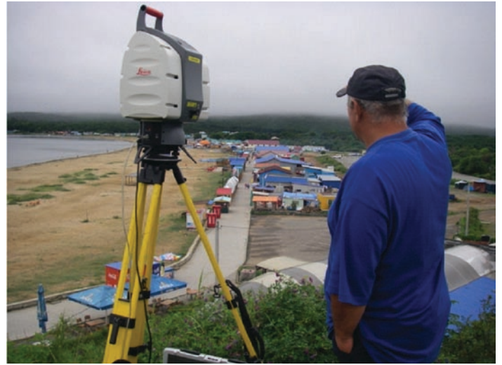
В 2012 г. Трест ГРИИ завершил первый этап работ по наблюдению за деформацией береговой линии залива Петра Великого в Приморском крае

способную производить съемку со скоростью 15 кадр/сек., плюс три сканера. Два из них с обзором 180° предназначены для фиксации местности справа и слева, и один с обзором 90° ориентирован по оси движения транспортного средства. За секунду данный комплекс способен выполнять до 40 тыс. измерений, имеющих метку времени и геопривязку. Это делает его особенно удобным для проектного обеспечения строительства новых, реконструкции и ремонта существующих автомагистралей, а также выводит на новый, более высокий, уровень процесс контроля за качеством уже выполненных работ. С помощью Топсон IP-S2 мы можем получить предельно достоверные данные для анализа состояния дорожной одежды, обочин, определения радиусов кривизны, виражей и т. п. Причем вся картина передается не в виде отдельных характерных точек, как при съемке электронными тахеометрами, а представляет собой огромный массив исчерпывающей информации, которая детально описывает дорогу на всем ее протяжении. Система обошлась недешево, но полностью себя оправдывает, и, убежден, уже в наступившем году будет использована на полную мощность.